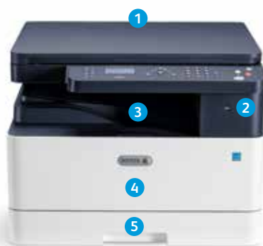
Πολυλειτουργικός εκτυπωτής Xerox® B1022

9 Ο εκτυπωτής Xerox® B1025 διαθέτει μεγαλύτερη έγχρωμη οθόνη αφής 4,3 ιντσών για πρόσθετη απλότητα.