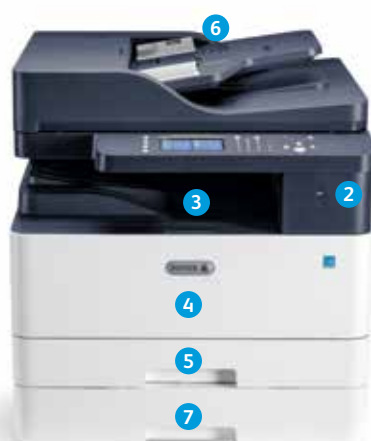
Πολυλειτουργικός εκτυπωτής Xerox® B1025

Η διαμόρφωση DADF απεικονίζεται με προαιρετικό πρόσθετο δίσκο.