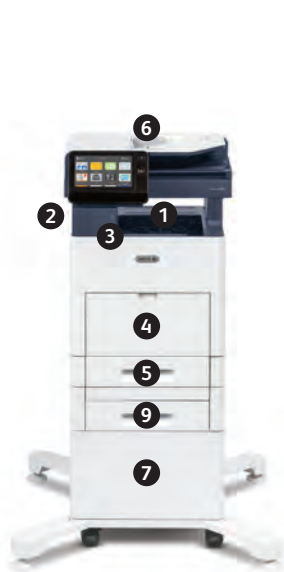
Πολυλειτουργικός εκτυπωτής Xerox® VersaLink® B615 Εκτύπωση, Αντιγραφή, Σάρωση, Φαξ, Email.